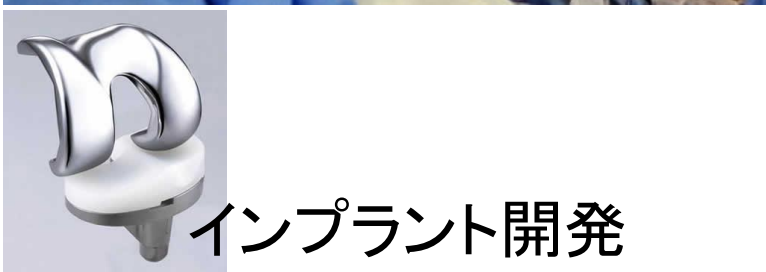
インプラント開発