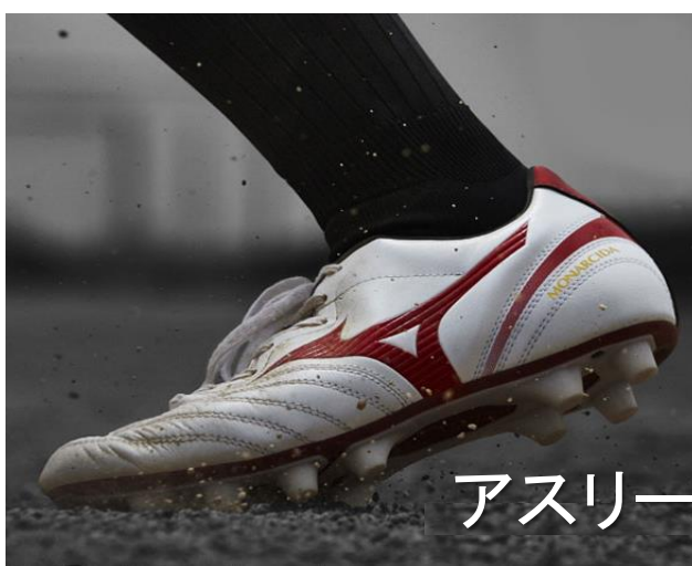
アスリートの治療